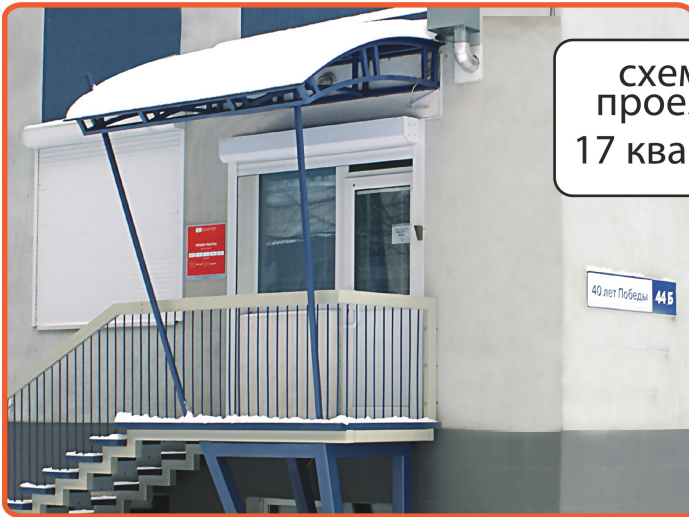
схема проезда 17 квартал